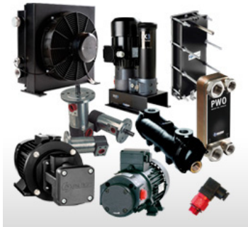
Öl/Luftkühler, Wärmetauscher (Platten o. Rohrbündel), Kühlsysteme (Öl- und Wasserkühlsysteme), Zubehör

Service- und Wartungskonzepte ganz individuell nach Ihren Vorstellungen und Gegebenheiten.