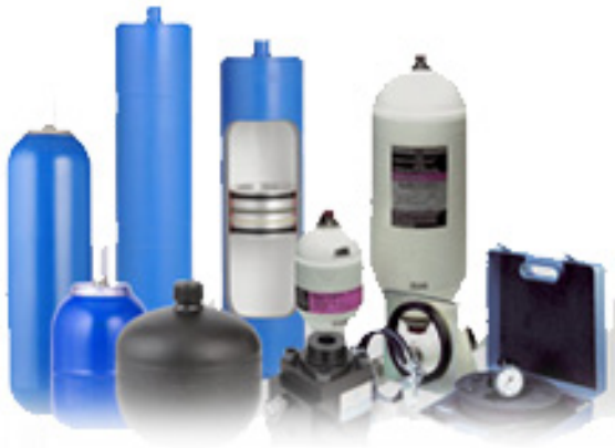
Blasen und Membranspeicher, Kolben- und Sonderspeicher, Speicherzubehör